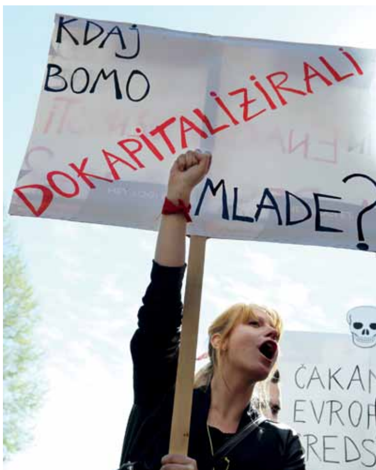
Protest študentov socialnega dela v Ljubljani spomladi leta 2015

posameznih pojavov. Kot aplikativne raziskave se štejejo tiste, ki ponudijo rešitve, ki jih lahko neposredno uporabimo v družbeni praksi in jih lahko tudi tržimo, temeljne pa so tiste, ki odpirajo polje, večajo razumevanje, četudi ne ponudijo neposrednih tehnoloških rešitev. Kaj sledi iz tega? Če imaš manj temeljnih premislekov, hitro zagovarjaš le eno rešitev, drugih pa ne upoštevaš. Na področju aplikativnega družboslovja potem recimo