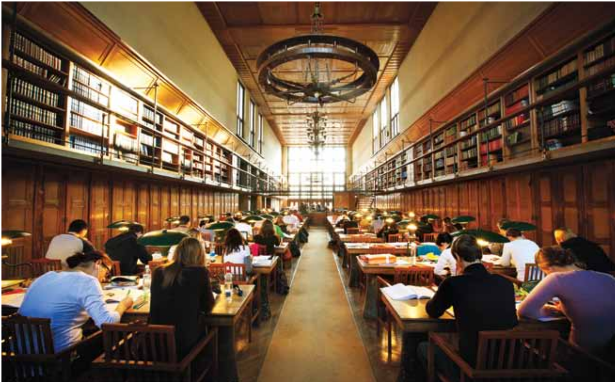
Narodna in univerzitetna knjižnica v Ljubljani

profesorjev, vsečnost večini, eden od kriterijev za napredovanje v profesorske nazive. Univerzitetni učitelji postajajo zbiralci točk, po načelu »publish or perish«. Kar je problematično, pojavlja se hiperprodukcija, pada kakovost, najboljši so tisti, ki največ objavljajo.