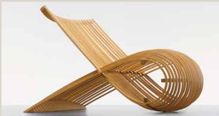
WOODEN CHAIR OBLIKOVANJE: MARC NEWSON, 1992 BLAGOVNA ZNAMKA: CAPPELLINI

IZBOR LEGENDARNIH OBLIKOVALSKIH IZDELKOV ZA DOM IN GOSPODINJSTVO