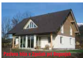
Pasivna hiša v Zgornji pri Begunjah