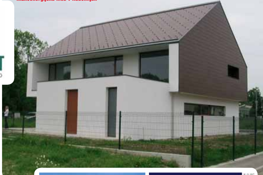
Nizkoenergijska hiša v Radomljah

e-mail: info@ekoprodukt.si splet: www.ekoprodukt.si