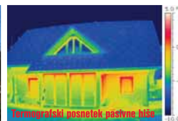
Termografski posnetek pasivne hiše