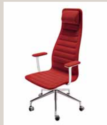
LOTUS OBLIKOVANJE: JASPER MORRISON, 2006/2007 BLAGOVNA ZNAMKA: CAPPELLINI