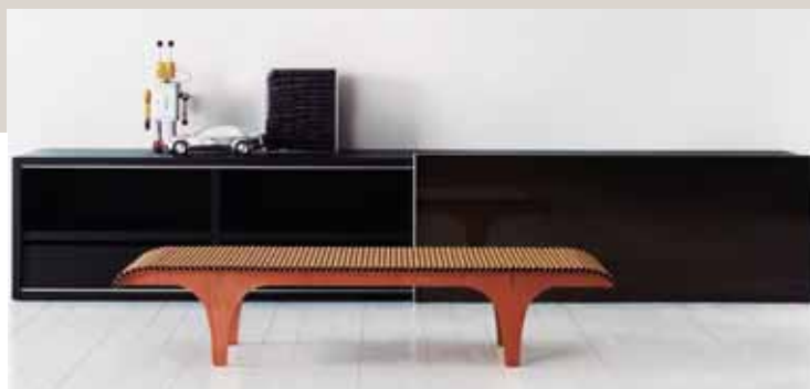
CARTA OBLIKOVANJE: SHIGERU BAN, 1999 BLAGOVNA ZNAMKA: CAPPELLINI