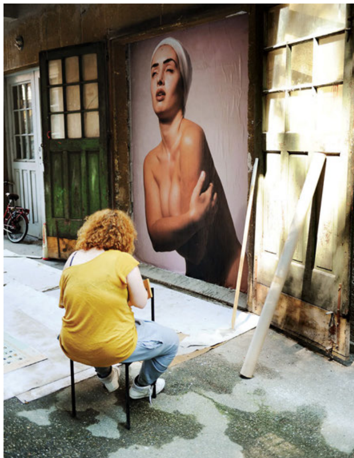
Postavitev zaključne razstave na študiju fotografije

šoli poučuje enega od teoretičnih predmetov. Magistrirala in doktorirala je na priznanem oddelku za tipografijo in grafično komunikacijo na Univerzi v Readingu, eni od najboljših šol za tipografijo na svetu, kjer je nekaj časa tudi predavala kot asistentka.