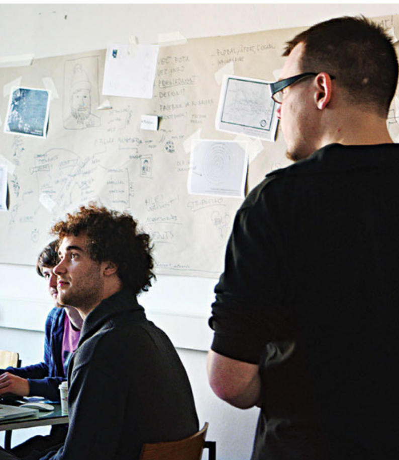
Skupinsko delo načrtovanja vidnih sporočil (tipografska delavnica prof. Leonidasa)