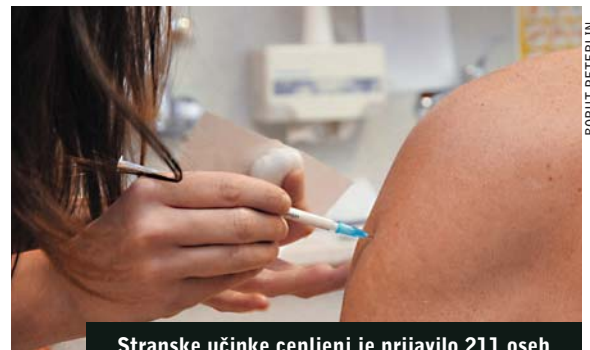
Stranske učinke cepljenj je prijavilo 211 oseb

Najmanj osem tisoč mrtvih in več milijonov okuženih je davek, ki ga je v manj kot letu dni terjal virus nove gripe H1N1. Virus so odkrili konec aprila v Mehiki, v nekaj tednih pa se je razširil na vse celine. Z enako hitrostjo kot virus so se razširile tudi teorije zarote o umetno povzročeni pandemiji gripe. Farmacevtske družbe so cepivo na trg poslale v rekordnem času, vendar z varovalko, da ne prevzemajo odgovornosti za morebitne stranske učinke. Če bi novi virus gripe mutiral v virulentnejšo obliko, bi bil to poleg vseh drugih posledic hud udarec za že tako izčrpano gospodarstvo, ki si še ni opomoglo od finančne in gospodarske krize. V Sloveniji se je po začetnem omahovanju cepilo več kot 100 tisoč ljudi, do sredine decembra pa je pri nas zaradi gripe umrlo 13 ljudi. (um)