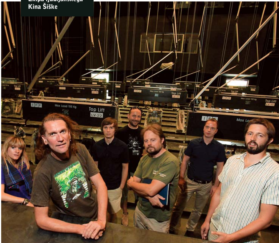
Ekipe ljubljanskega Kina Šiške