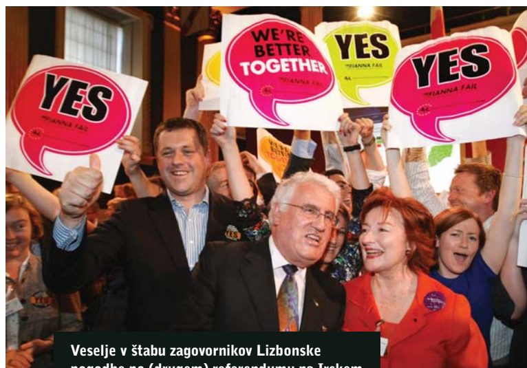
Veselje v štabu zagovornikov Lizbonske pogodbe po (drugem) referendumu na Irskem