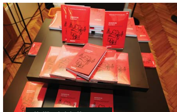
Knjižna izdaja Konzuma