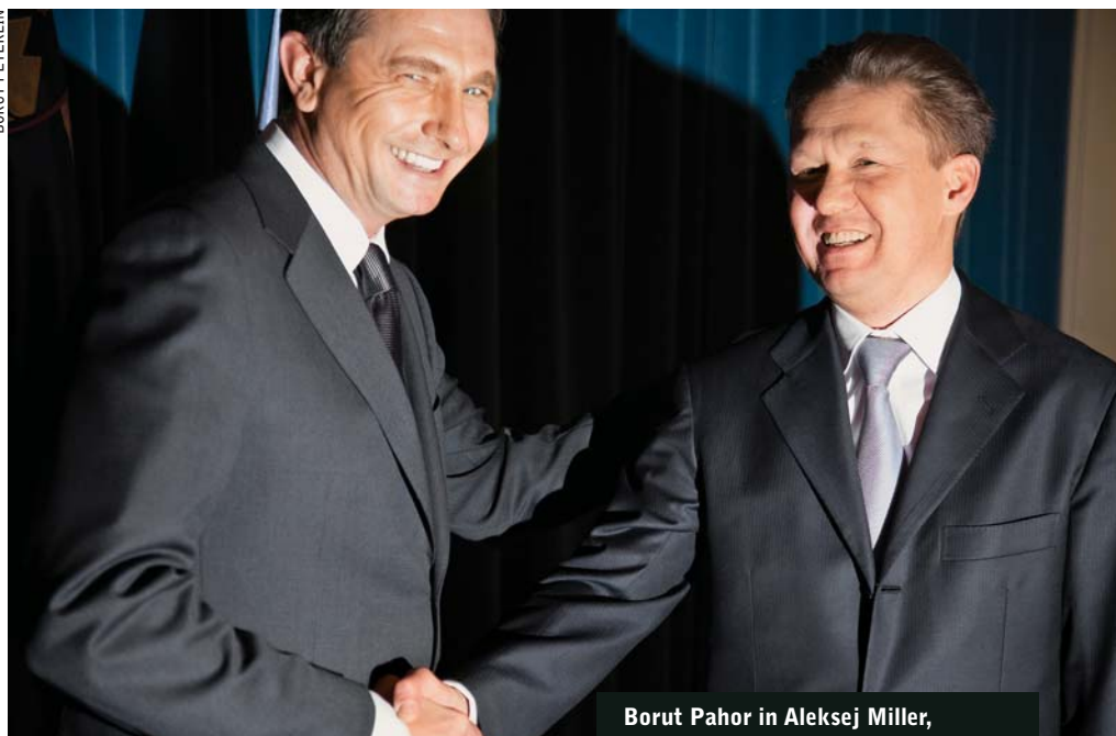
Borut Pahor in Aleksej Miller, predsednik uprave ruskega Gazproma