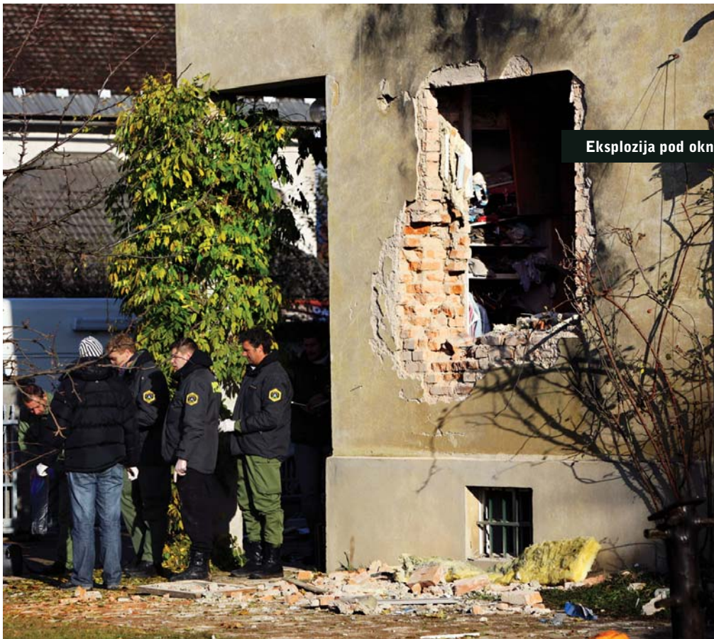
Eksplozija pod oknom sodničine hčerke