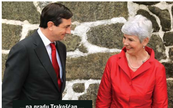
... na gradu Trakoščan ...