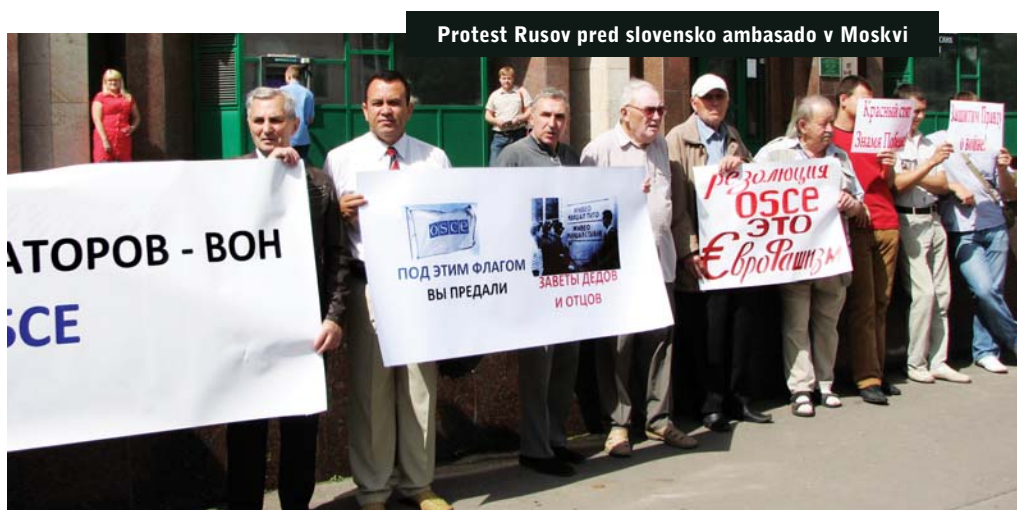
Protest Rusov pred slovensko ambasado v Moskvi

V iztekajočem se letu se je (še enkrat) bil boj s totalitarizmi. Snovale in sprejemale so se resolucije o njihovi zločinski naravi. Resolucija OVSE o združitvi razdeljene Evrope, ki je izenačila nacizem in stalinizem, je razbesnela Ruse. Demonstrirali so celo pred slovenskim veleposlaništvom v Moskvi, ker je bil njen soavtor naš poslanec Roberto Battelli. Resolucija evropskega parlamenta o evropski zavesti in totalitarizemih pa je razplamtela politične strasti v Sloveniji, kajti desnica je trdila, da »naš« komunizem ni bil nič manj totalitaran od tistega v srednji in vzhodni Evropi. Leвица je imela ločeno mnenje. Nazadnje se je državni zbor z resolucijo seznanil, ni pa je sprejel. SDS je sicer še vedno prepričana, da v Sloveniji vladajo postkomunistične sile totalitarne preteklosti. (mh)