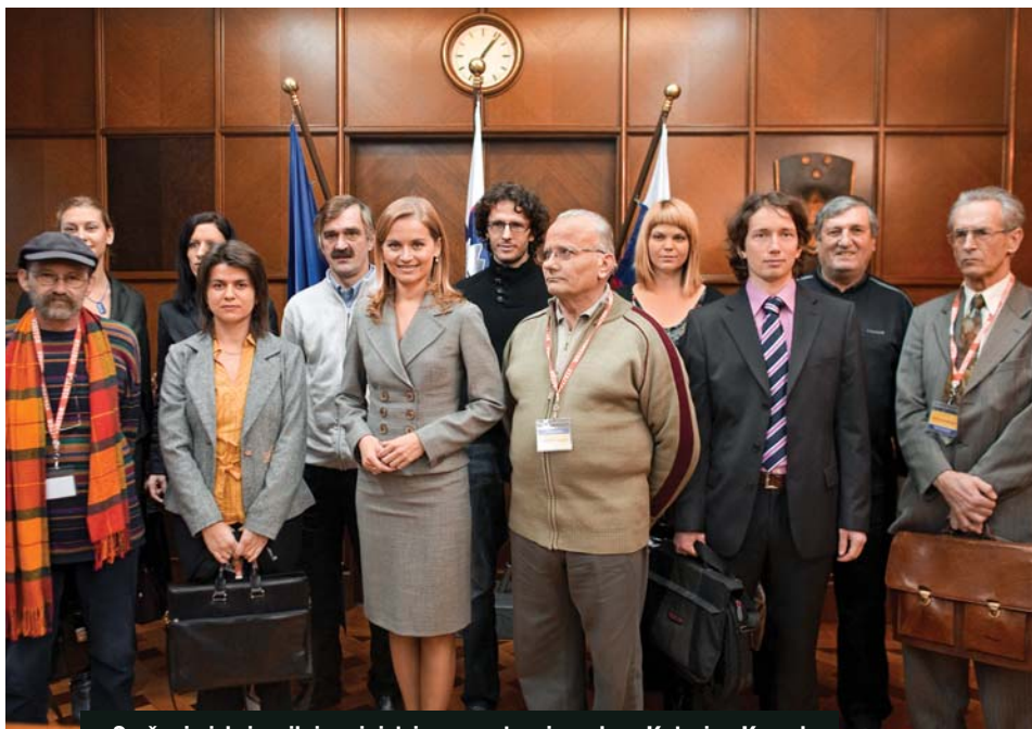
Srečanje izbrisanih in ministrice za notranje zadeve Katarine Kresal

Ministrstvo za notranje zadeve pod vodstvom KATARINE KRESAL je izbrisanim z urejenim statusom izdalo dopolnilne odločbe in pripravilo še zadnji zakon o izbrisanih, ki naj bi dokončno vsaj minimalno zadostil zahtevam kar treh odločb ustavnega sodišča. Po tem zakonu bo do ureditve nezakonito odvzetega statusa upravičenih še preostalih približno 12 tisoč izbrisanih. Status stalnega prebivališča jim bo vrnjen za nazaj, na podlagi odločbe ne bodo mogli vlagati prošenj za državljanstvo, pravico do odškodnine pa bodo morali dokazovati na sodišču. Nerešeno vprašanje izbriša je še 17 let po tem, ko se je izbrisil zgodil, glavni očitke uradnih in nevladnih mednarodnih organizacij. Slovenija se recimo zaradi izbrisanih in Romov vsako leto znajde na črni listi organizacije Amnesty International. Politična desnica pa težkega orožja zaradi izbrisanih vsaj v letu 2009 ni uporabila. Kako bo naslednje leto, bomo še videli ... (pp)