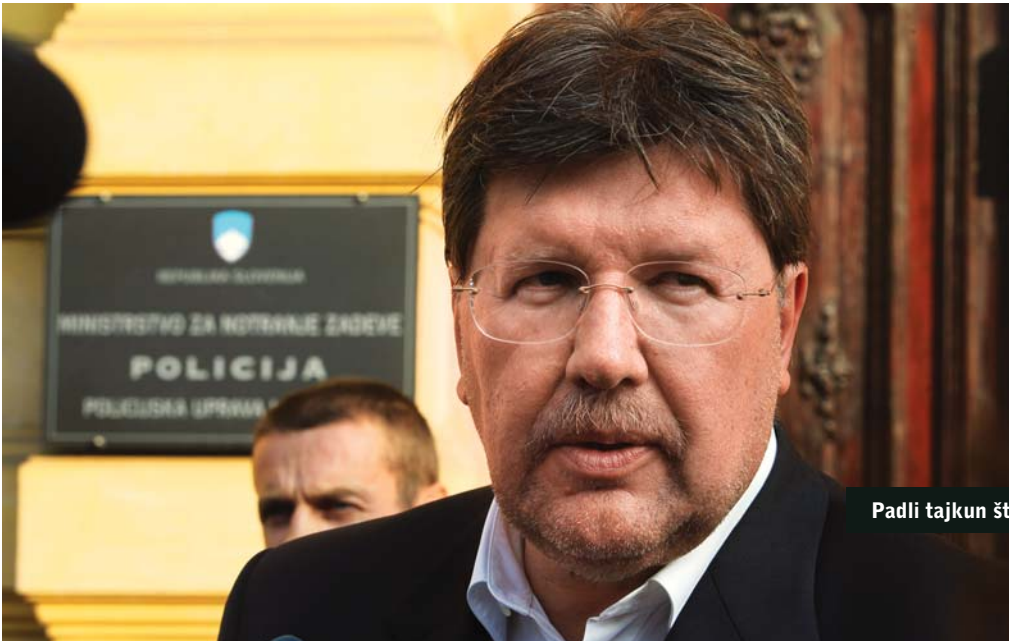
Padli tajkun št. 1 - Igor Bavčar