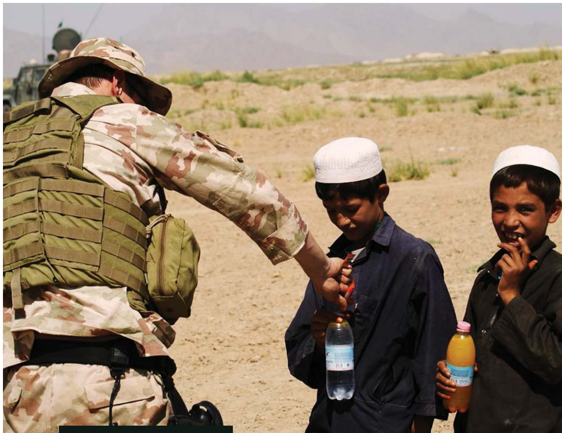
Slovenski vojaki v Afganistanu

Iraške lokalne volitve januarja so bile tako uspešne, da je prišel Iračanom osebno čestitat celo generalni sekretar OZN Ban Ki-mun. Nasilja skorajda ni bilo, udeležba pa je bila razmeroma visoka, 51-odstotna, kar je primerljivo z udeležbo v marsikateri zahodni državi. Popolno nasprotje so bile afganistanske predsedniške volitve avgusta, zaznamovane z nasiljem talibanov in s številnimi poneverbami, ki so predsedniku Hamidu Karzaju nov mandat zagotovile že v prvem krogu. Šele po pritisku mednarodne skupnosti je privolil v drugi krog volitev, a se je njegov tekmeček Abdulah Abdulah kmalu zatem umaknil, ker naj ne bi bilo nobenih resnih zagotovil, da bo drugi krog poštenjši od prvega. (ev)