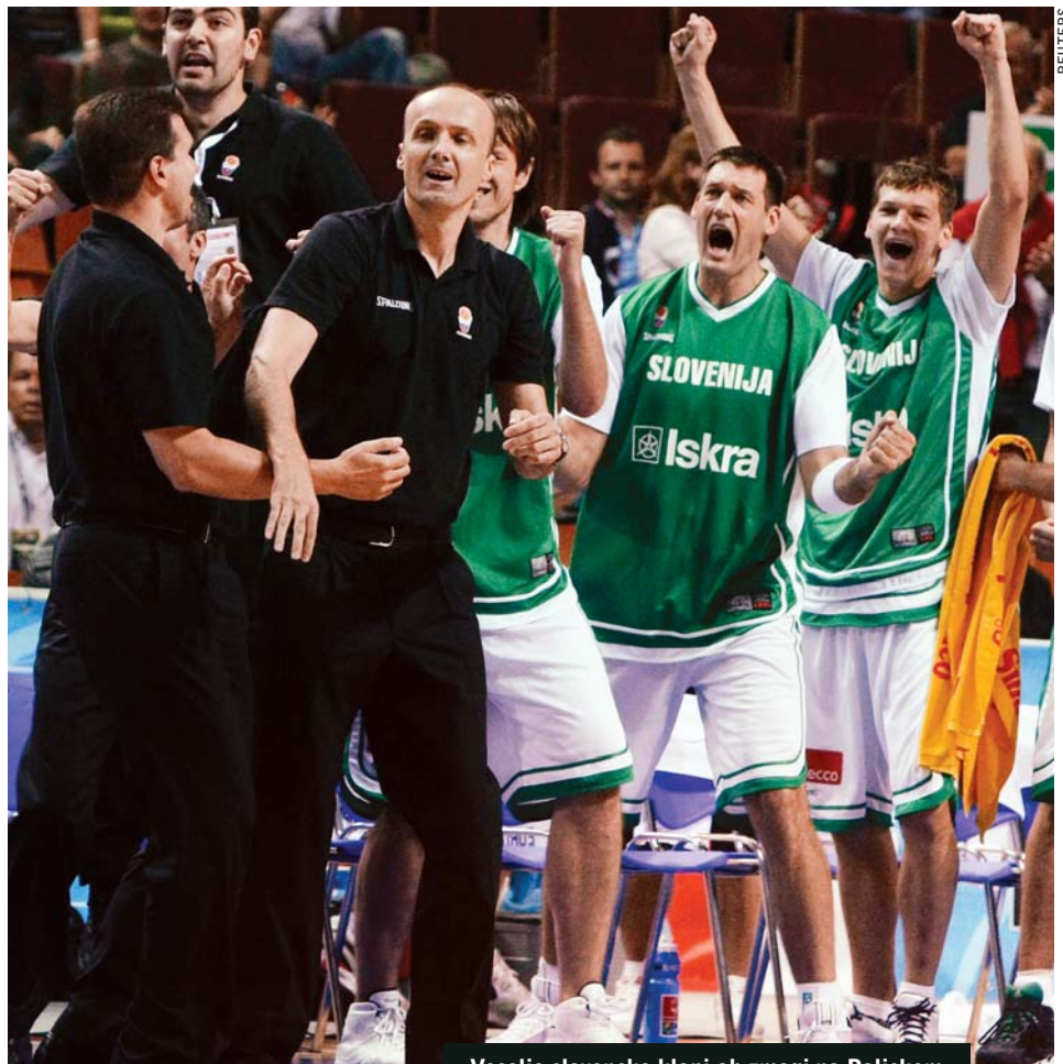
Veselnje slovenske klopi ob zmagi na Poljskem