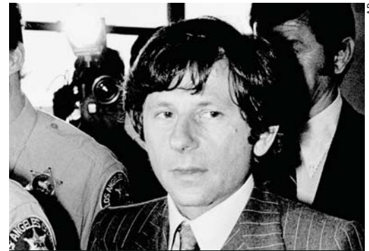
Roman Polanski leta 1977, ko je storil posilstvo

Septembra letos je švicarska policija presenetila legendarnega filmskega režiserja Romana Polanskega in ga aretirala na poti na filmski festival v Zürichu, kjer naj bi prejel nagrado za življenjsko delo. Za Polanskim je bila še vedno razpisana tiralica zaradi posilstva 13-letnice leta 1977. Polanski je, tik preden bi moral odslužiti zaporno kazen, zbežal v Francijo in se izogibal državam, ki bi ga morda lahko izročile ZDA in kalifornijski policiji. Čeprav je žrtvi, danes stari 45 let, plačal pol milijona dolarjev odškodnine, je njegov primer še vedno odprt. Zdaj je v hišnem priporu. Številni filmski delavci so že protestirali proti temu, da bi Polanskega zaprli. (dc)