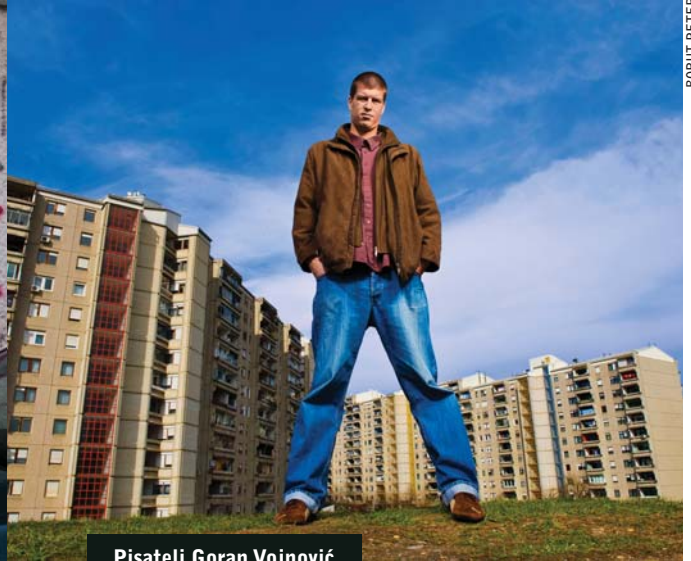
Pisatelj Goran Vojnovič