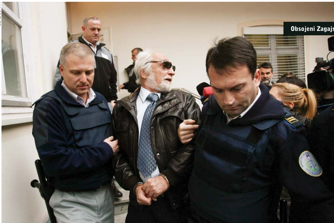
Obsojeni Zagajski pred sodiščem