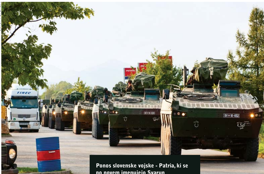
Ponos slovenske vojske - Patria, ki se po novem imenujejo Svarun