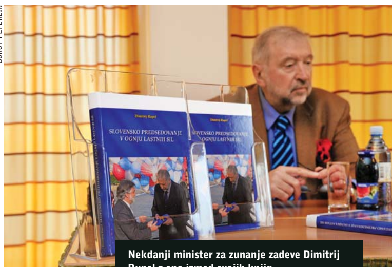
Nekdanji minister za zunanje zadeve Dimitrij Rupel z eno izmed svojih knjig