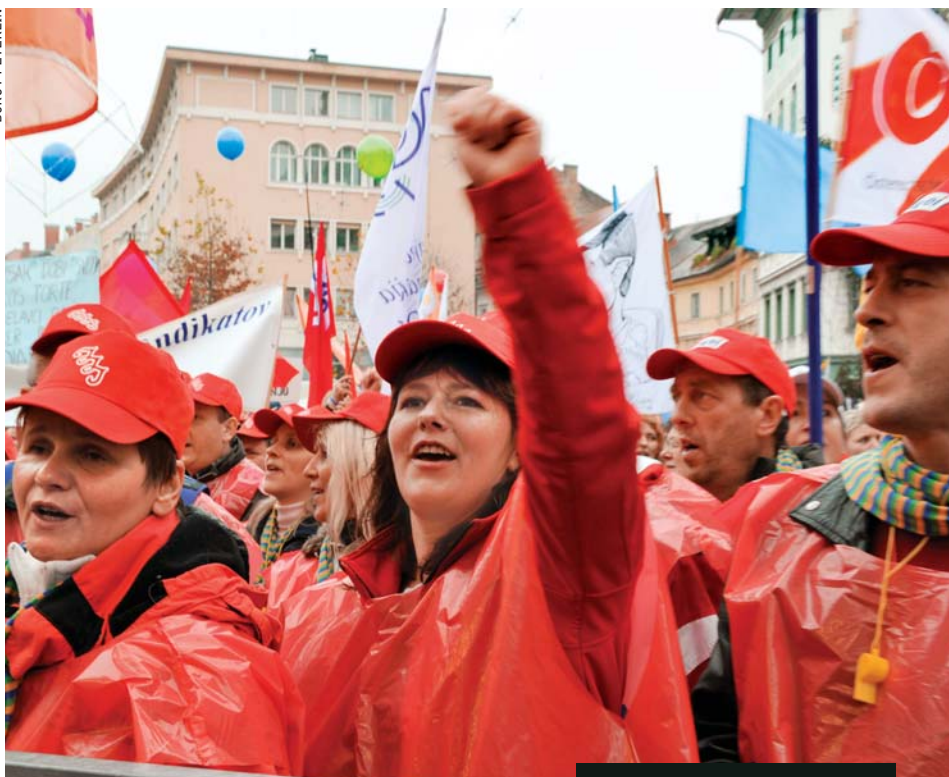
Prešernov trg, 28. novembra

ca, vodstvo policije pa je nato priznalo napako in pregon umaknilo. Roman je sicer prejel nagrado Prešernovega sklada in nagrado kresnik za najboljši roman leta, doživel pa je tudi gledališko uprizoritev. (vp)