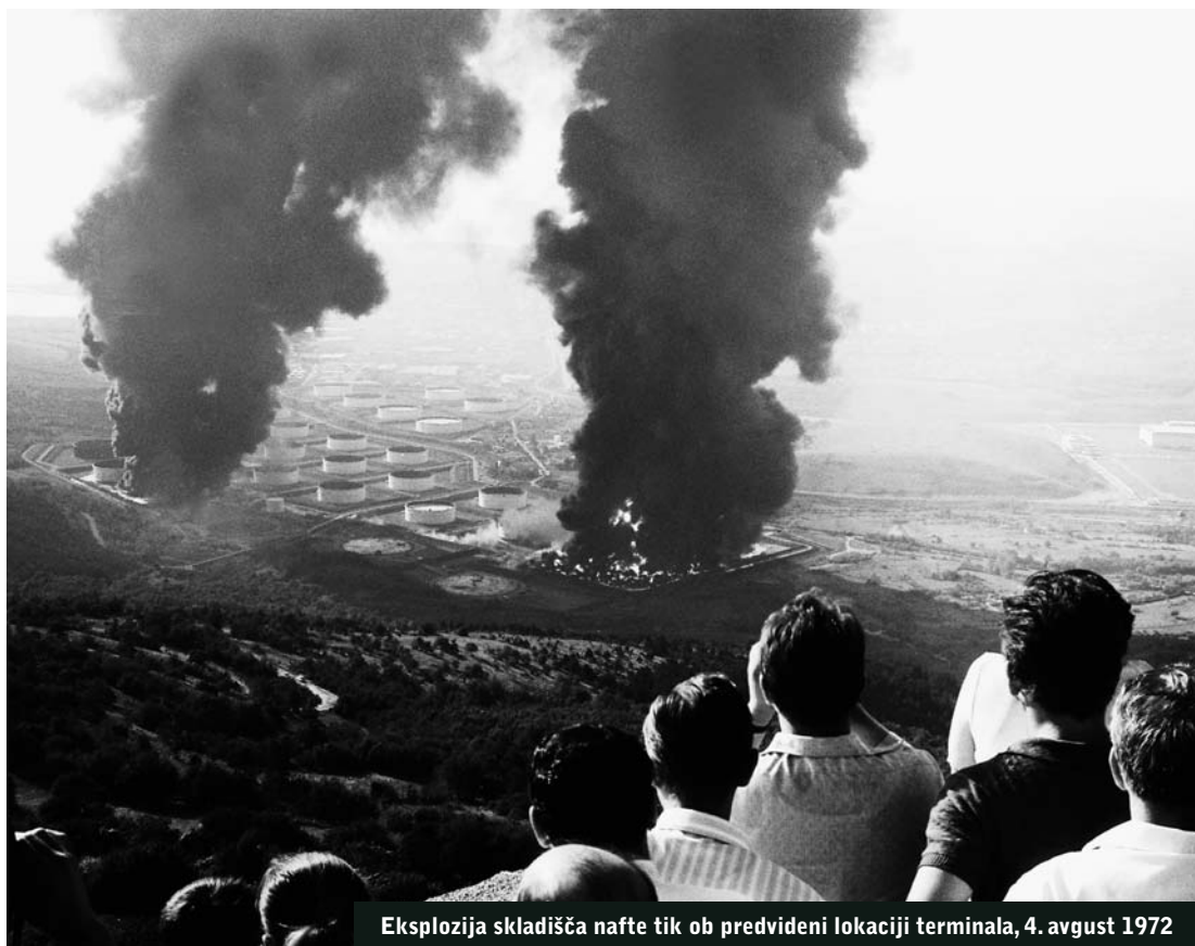
Eksplozija skladišča nafte tik ob predvideni lokaciji terminala, 4. avgust 1972

Terminali za utekočinjeni plin v Jadranskem morju so letos postali realnost. Prvi, na morju, je začel obratovati v bližini Benetk v Italiji. Blizu je tudi začetek gradnje kopenskega terminala v Žavljah, za katerega pa Slovenija zaradi pomanjkljive dokumentacije za zdaj še ni dala soglasja. Zdi se sicer, da to Italijanov ne bo ustavilo, a vseeno jih verjetno vsaj malo skrbi slovenska grožnja s tožbo pred evropskim sodiščem. Tudi Slovenija pa namerava pristaviti svojo plinsko jeklenko, saj na ministrstvu za gospodarstvo že načrtujejo traso za plinovod od predvidenega terminala na Krku. Poleg tega niti načrti za terminal v Kopru niso povsem opuščeni. (sz)