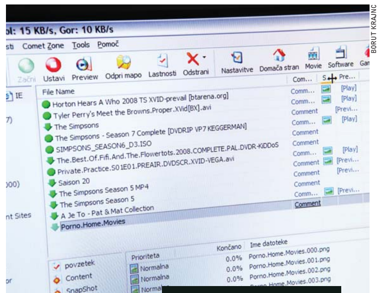
(Nelegalno) prenašanje datotek

Leto 2009 ni bilo ravno prijazno do spletnega piratstva. Multinacionalkam je po dolgotrajnih poskusih s tožbo vendarle uspelo načeti legendarni portal za izmenjavo datotek PirateBay, njegovim ustanoviteljem pa grozi zaporna kazen. Jeseni je ugasnil še en podoben legendaren portal - Mininova. Francija je sprejela zakon o preprečevanju spletnega piratstva, ki omogoča odklop internetnega priključka brez odredbe sodišča, če uporabnika trikrat zalotijo pri nezakonitem prenašanju zaščitene datoteke. Podobne zakone pripravljajo tudi v Veliki Britaniji, Španiji ... Je pa evropski parlament zato dobil prvega poslanca Piratske stranke, to stranko pa so (ne ravno uspešno) poskusili ustanoviti tudi v Sloveniji. (sz)