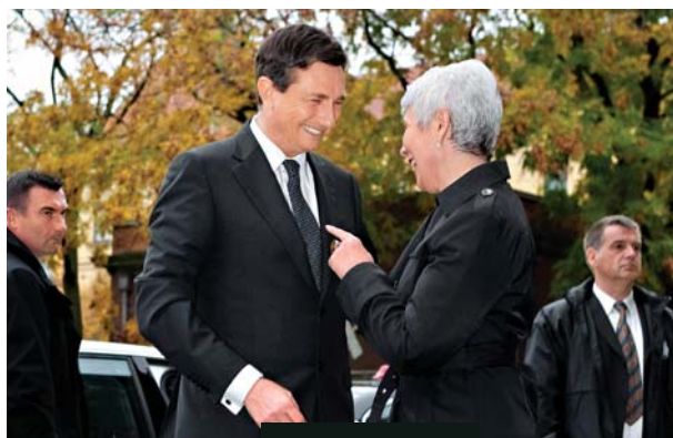
... in v Zagrebu.