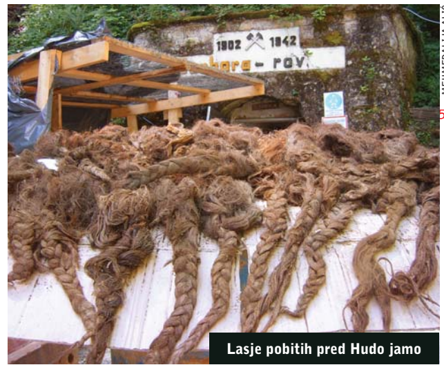
Lasje pobitih pred Hudo jamo

V opuščnem rudarskem jašku v Hudi Jami pri Laškem so odkrili množično grobišče. V njem naj bi bili po 2. svetovni vojni pobiti večinoma pripadniki slovenskih domobranskih in ustaških formacij. Podobe iz Hude Jame so postale senzacionalistična tema, ker je levica, kot je opozoril Slavoj Žižek, zamudila priložnost, da bi, »ne zaradi pritiska nasprotnikov, zaradi nas samih«, stvari razčistila. »Žrtev manipulacije« in političnega zgražanja je bil tudi predsednik Danilo Türk, ki je ob mednarodnem dnevu žena, resda zelo nerodno, dejal, da je tistega dne zanj Huda Jama »drugorazredna tema«, vprašanje žensk pa »izjemno pomembna, prvorazredna tema v Sloveniji, politična tema«. Preiskovanje množičnega grobišča se nadaljuje, število žrtev, bilo naj bi jih več tisoč, pa še ni ugotovljeno. (mh)