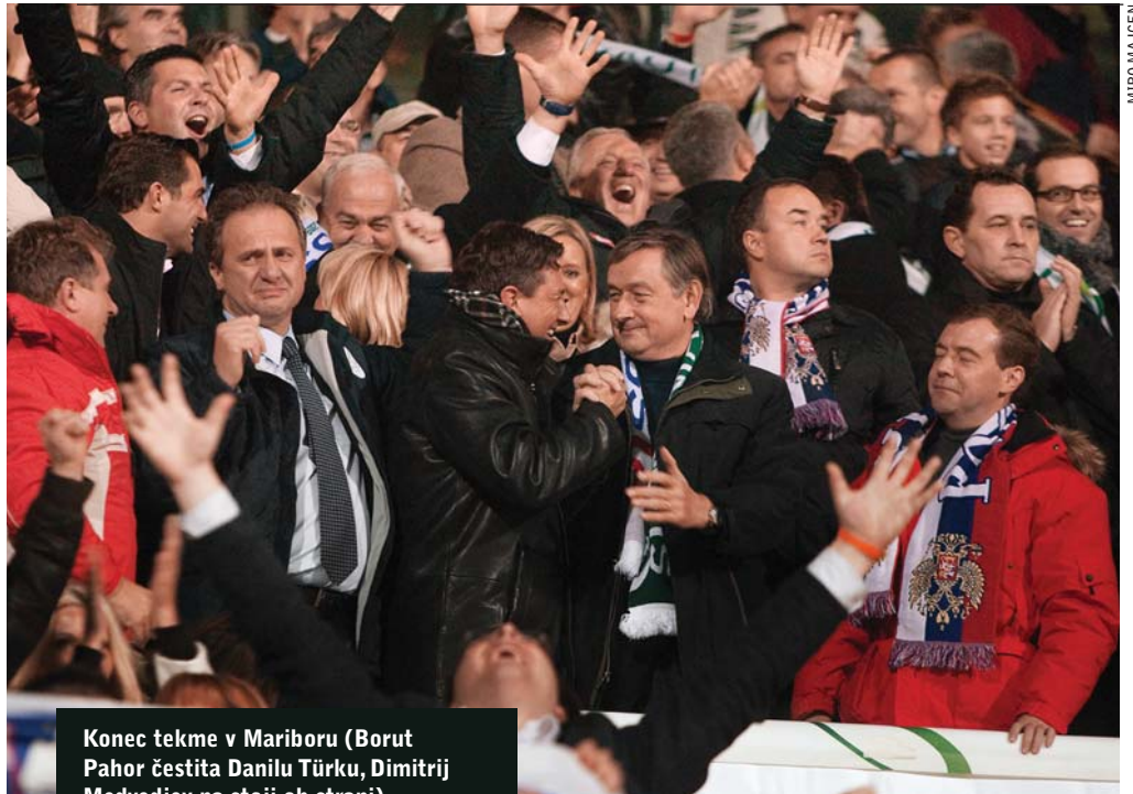
Konec tekme v Mariboru (Borut Pahor čestita Danilu Türku, Dimitrij Medvedjev pa stoji ob strani)