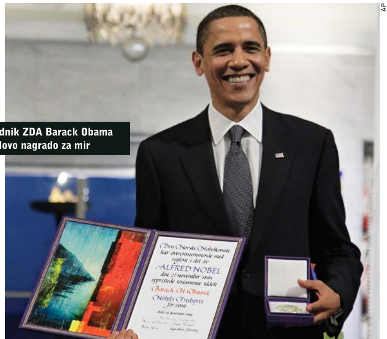
Predsednik ZDA Barack Obama z Nobelovo nagrado za mir