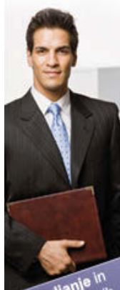
Upravljanje in vodenje poslovnih sistemov